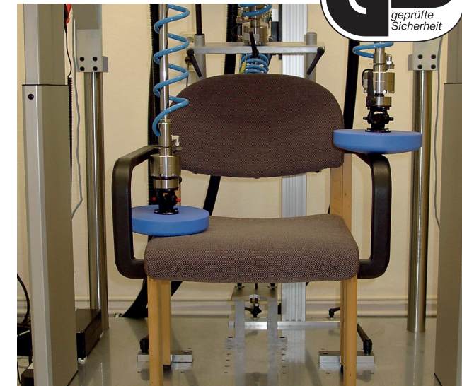
Festigkeitsprüfung einer Armlehne